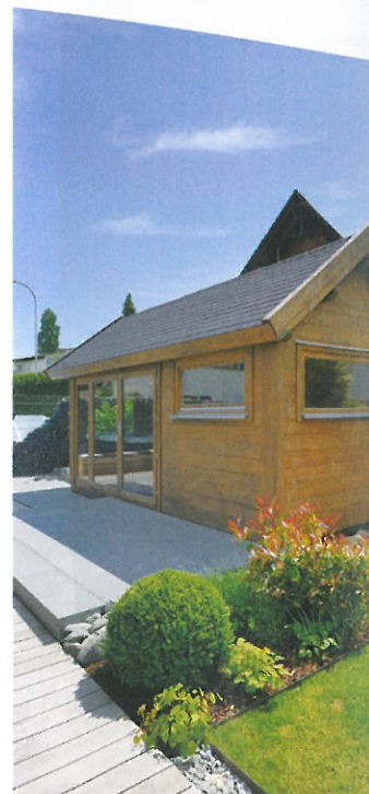
Bild Mitte Drei Seiten der Gartensauna verfügen über großzügige Fenster, sodass die Nähe zur Natur auch im Inneren jederzeit zu spüren ist.

Bild links Das Saunahaus präsentiert sich mit Satteldach und ist so optisch perfekt an das Wohnhaus angepasst.