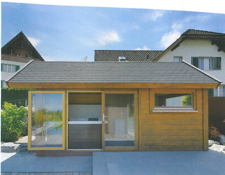
Bild oben Drinnen wird draussen: Die Haupttür des Wellnesshauses kann einfach geöffnet werden.

Bild links Das Saunahaus präsentiert sich mit Satteldach und ist so optisch perfekt an das Wohnhaus angepasst.